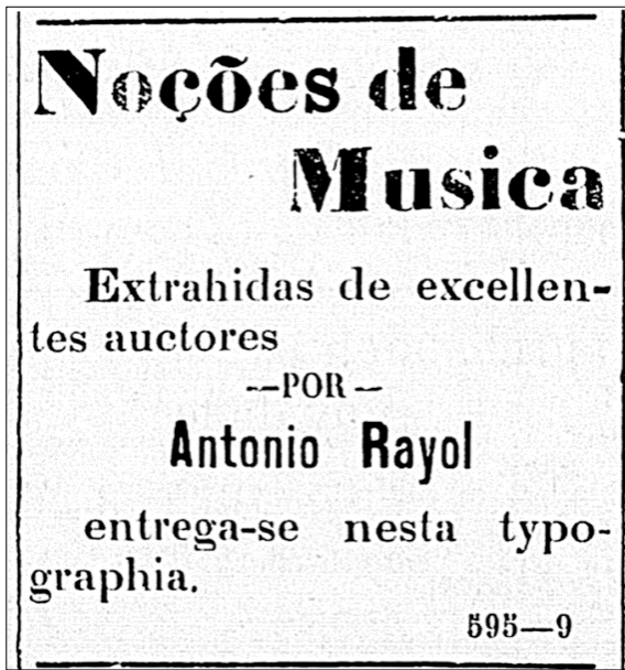
Figura 2: Anúncio do livro Noções de musica , de Rayol.