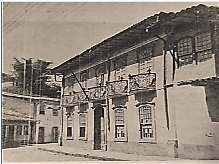
Foto 1: Antigo edifício da Instrução Pública onde funcionou a Escola de Farmácia