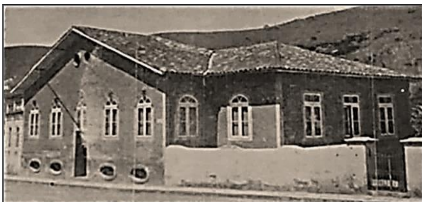
Foto 2: Edifício da antiga Faculdade de Direito de Ouro Preto e onde funcionou a Escola de Farmácia depois que se separou da Diretoria de Instrução Pública