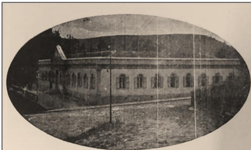
Foto 3: Antigo edifício do atual Museu da Pharmacia de Ouro Preto

Fonte: Imagem retirada da obra "Apontamentos Históricos da Escola de Farmácia de Ouro Preto", segunda edição atualizada, abril de 1961. Autor: Alberto Coelho de Magalhães Gomes.