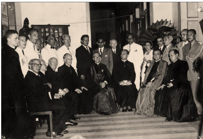
Imagem 2: Em 18/08/1953 com personalidades do Pará e alguns membros da Academia Paraense de Letras.