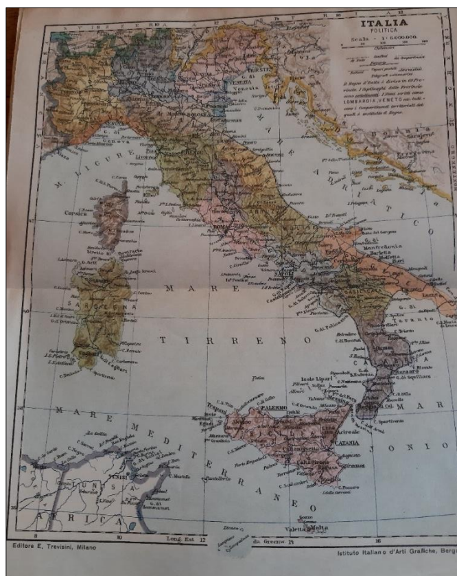
Figura 3 - Mapa da Itália

A terceira seção do livro é dedicada às noções de Geografia. O autor organiza o texto em torno de duas temáticas, uma bastante geral sobre corpos celestes, suas formas, grandeza; movimentos da terra, pontos cardeais, cartas topográficas; e uma segunda temática, voltada à Itália, suas características geográficas, como montanhas, mares, rios, lagos, golfos, ilhas, canais, vulcões etc; suas fronteiras; a organização político-administrativa em regiões; os produtos naturais, animais e minerais, a indústria e o comércio. Nas duas últimas páginas do livro tem um mapa colorido da Itália (figura 2), que provavelmente era utilizado para facilitar a compreensão das temáticas dessa seção.