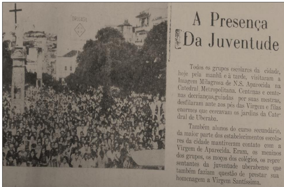
Figura 3: Notícia sobre “A Presença da Juventude” na Catedral Metropolitana de Uberaba