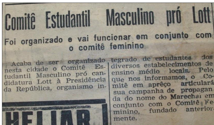
Figura 1 - Matéria sobre o “Comitê Estudantil Masculino pró Lott”

Em tal contexto de adesão de diversos setores ao golpe civil-militar, os discentes triangulinos foram observados com maior proximidade pela imprensa escrita. Visto que, considerável parte destes apoiara a chapa Lott e João Goulart nas eleições a presidência e a vice-presidência da República no ano de 1960: