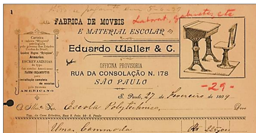
Figura 5 - Nota de compra da Escola Polytechnica