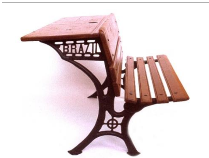
Figura 1 - Carteira Brazil CRE Mario Covas