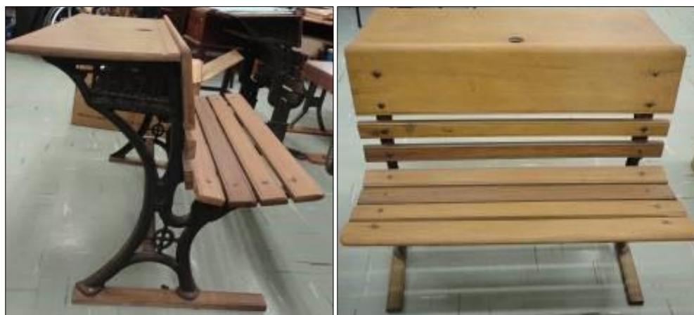
Figuras 2 e 3 - Carteira Brazil – CMFEUSP

Fonte: Centro de Memória da Faculdade de Educação da USP