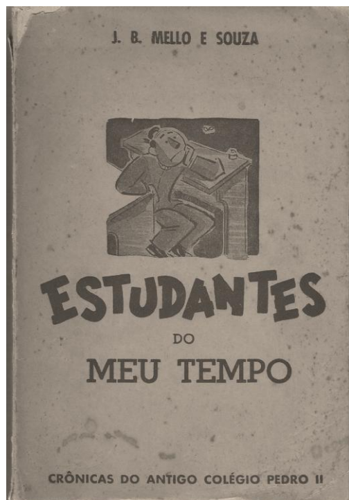
Figura 01 - Capa do livro Estudantes do meu tempo (1958).