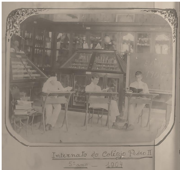
Figura 03 – Fotografia no interior de uma das salas do Colégio Pedro II, 1904. A imagem foi reproduzida no livro Estudantes do meu tempo (1958).