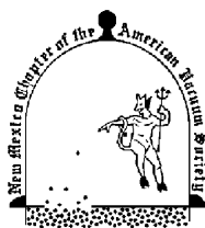
Figura 1: Caricatura do demônio da pressão, antigo símbolo da Sociedade Americana de Vácuo.