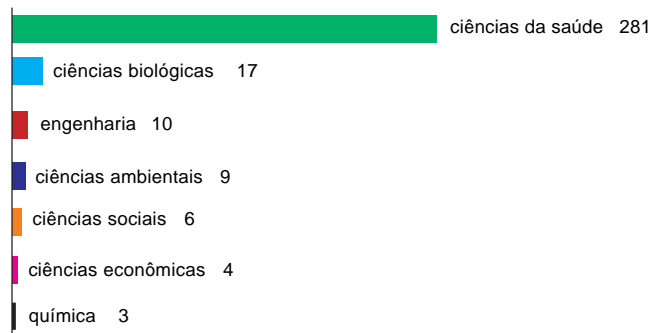
Gráfico 2. Distribuição dos autores por grandes áreas de conhecimento

Com relação à formação/filiação institucional do primeiro autor, percebemos que o padrão anterior é mantido, ou seja, a maioria deles é formada por ou vinculada a instituições ligadas às Ciências da Saúde.