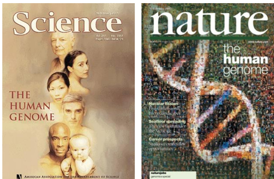
Figura 3. Capas dos periódicos Nature e Science, respectivamente de 15 e de 16 de fevereiro de 2001 2 .