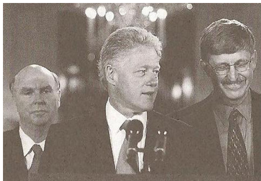
Figura 2. A divulgação do rascunho do genoma, no ano 2000, em cerimônia na Casa Branca

Legenda: da esquerda para a direita: Craig Venter, o então presidente dos Estados Unidos Bill Clinton e Francis Collins.