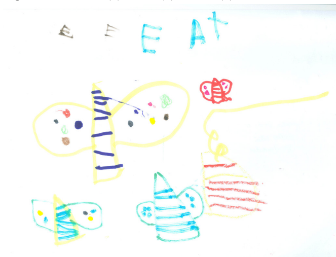
Figura 4. Borboletas (1), casulo (2) e árvore (3)