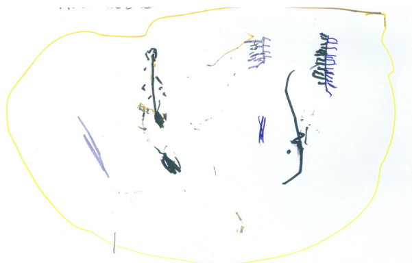
Figura 1. Borboletas