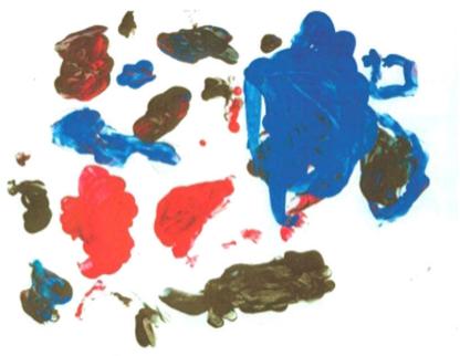
Figura 7. Desenho de borboleta (lápis sobre papel coberto com tinta guache)