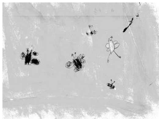
Figura 5. Releitura da obra “Evocação de borboletas” (Redon)