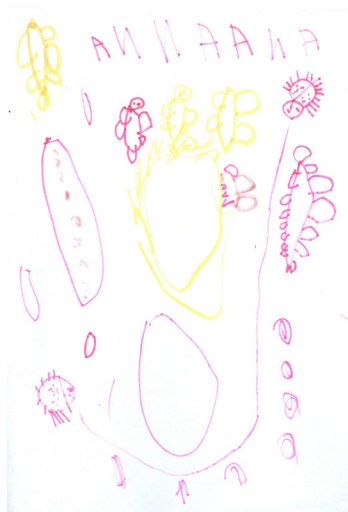
Figura 9. 1 – casulo; 2 – larvina; 3 – lagarta; 4 – um monte de folhinhas; 5 – borboletas; 6 – flor para as borboletas ficarem; 7 – joaninha filha; 8 – joaninha mãe; 9 – caminho para as joaninhas se encontrarem; 10 – bolinhas para a lagarta comer dentro do casulo