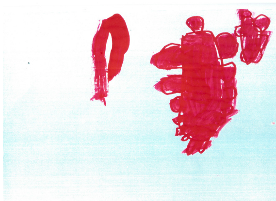
Figura 8. Duas borboletas