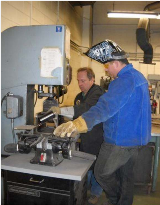
Estudiante del módulo de Soldadura en SAIT.

dante del programa de Soldadura con su formador mientras aprende a utilizar la maquinaria.