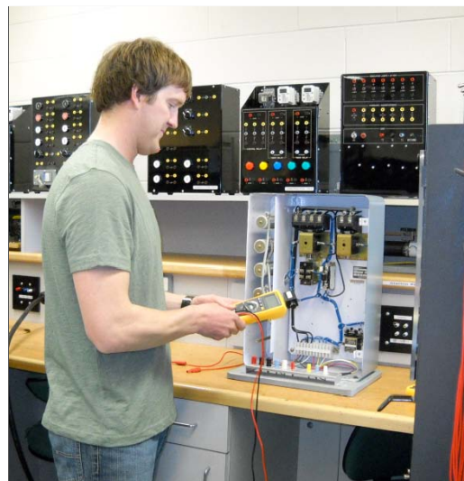
Estudiante del módulo de Electricidad en SAIT.

Durante la investigación ha quedado en evidencia la importancia del papel de los instructores en la experiencia docente. Los entrevistados en este proyecto señalaron el hecho de que los cambios en el aprendi-