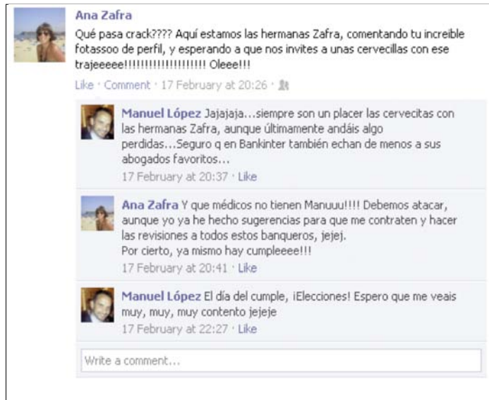
Imagen 2. Captura del muro del usuario estudiado en el caso 2.

hacen referencias a temas sociales presentes en la opinión pública. Como en el antiguo ágora, estamos en un espacio público que permite comunicarse sin trabas ni censura (Dahlberg, 2001: 617). La escasa participación del usuario 3 y el tono de sus comunicaciones están de acuerdo con el perfil: por un lado estos usuarios concentran su actividad en la red Tuenti; por otro, el lenguaje de los usuarios de esta edad suele ser pobre y lleno de incorrecciones. Estamos ante una comunicación escrita que está muy contaminada por las características de la oral (Yus, 2011). Por el resto de su actividad en el muro, apreciamos que ha utilizado la red para relacionarse (aceptación de amistad, catalogación de un perfil o colgar vídeos), más que para dialogar.