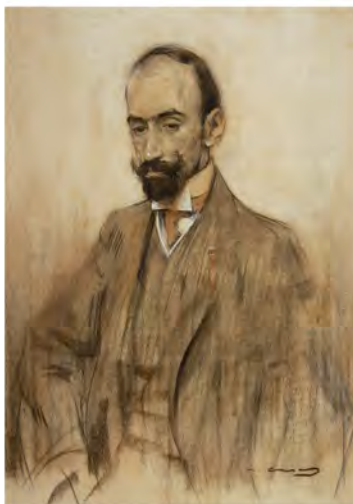
JACINTO BENAVENTE (1866-1954)

«CUANDO NO SE PIENSA LO QUE SE DICE ES CUANDO SE DICE LO QUE SE PIENSA»