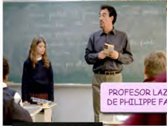
PROFESOR LAZHAR, 2011 DE PHILIPPE FALARDEAU