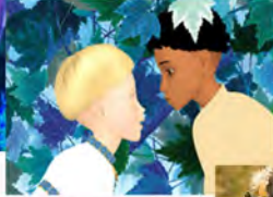
AZUR Y ASMAR 2004 DE MICHEL OCELOT