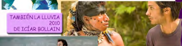
TAMBIÉN LA LLUVIA 2010 DE ICÍAR BOLLAIN