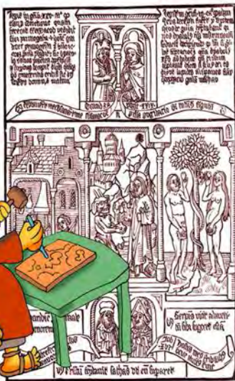
BIBLIA PAUPERUM (1410-1420)