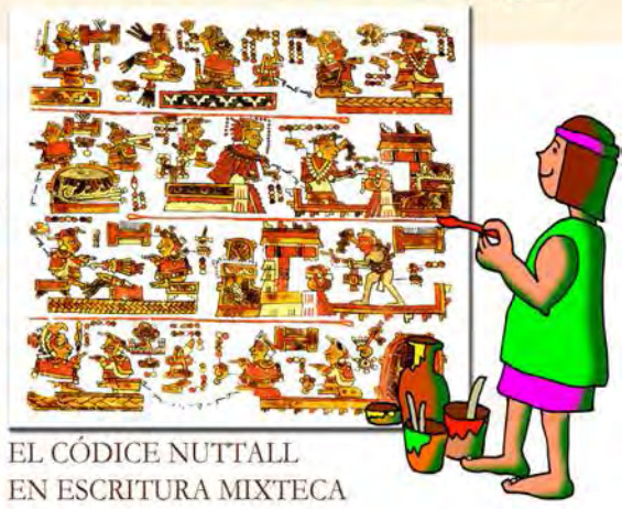
EL CÓDICE NUTTALL EN ESCRITURA MIXTECA