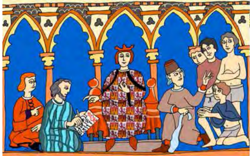
CANTIGAS DE SANTA MARÍA (1284)