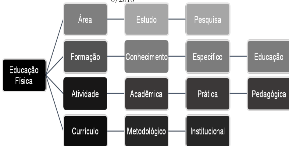
Figura 2 – Atribuições dadas à Educação Física pela Resolução CNE n. 6/2018

A observância acerca da formação inicial, a partir da Resolução CNE n. 6/2018, aponta, ainda, a uma efetivação propositiva de políticas neoliberais, inseridas no contexto dos cursos de formação inicial em Educação Física. O reducionismo ideológico, a inexistência de coeficientes que indiquem uma formação humana com vistas à emancipação e à autonomia do futuro profissional, sucumbem à apresentação de uma proposta normativa, cujos pressupostos teóricos buscam efetivar uma formação inicial com vistas a suprir as demandas e necessidades de conhecimento, as quais favoreçam a reprodução do modo de produção do mundo do trabalho. Esses cenários da formação inicial, nos cursos de Educação Física, esquematizados na Figura 2, como atribuições à formação docente, apontam para o desenho de uma perspectiva de precarização do trabalho docente, cuja formação ofertada pelas IESs limita-se a cumprir as normativas e orientações ditadas pela resolução citada, fragilizando o processo, tornando-o uma ação aligeirada em relação às necessidades de promover embates epistemológicos acerca da atuação e efetivação no campo profissional.