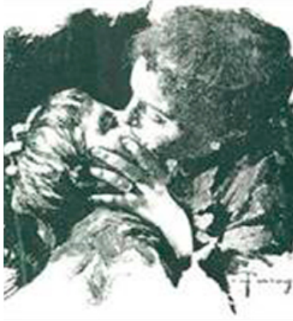
Figura 2: Imagem de capa (1916 e 1924)

Para ampliar a compreensão dessa imagem e da relação simbólica entre as duas personagens, é necessário buscar dados referentes aos registros do próprio autor, De Amicis, sobre suas motivações relativas à escrita desse livro. Uma carta de 1878 dirigida ao editor Treves, publicada no livro de Pino Boero e Giovanni Giovanese (2009), 12 traz dados esclarecedores, nos quais o autor explica as ideias para o ainda futuro texto. Boero e Giovanese comentam o desejo expresso por De Amicis em comunicar o ideal de escola para todos, em qualquer lugar da Itália, que se concretiza na escrita. A obra de De Amicis encerra a utopia de uma educação que tem por base o afeto e cujos heróis são os agentes da escola: professores abnegados e família presente e afetuosa.