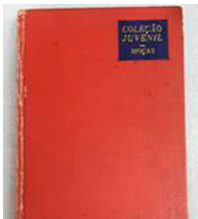
Figura 8: Coração , 1 ed. Ibis: capa e folha de rosto

O quarto exemplar a ser analisado segue o padrão de formato de bolso e apresenta capa original na cor vermelha (Figura 8A), que identifica apenas a coleção a que a obra pertence, “Coleção Juvenil – Moças”. O título da obra aparece na lombada, sobre detalhes dourados. Trata-se da 1ª edição do Editorial Ibis – Livraria Bertrand / Portugal-Brasil, traduzida da língua espanhola. A folha de rosto é ilustrada e traz o título, autor e editor sobrepostos em uma imitação de pergaminho (Figura 8B).