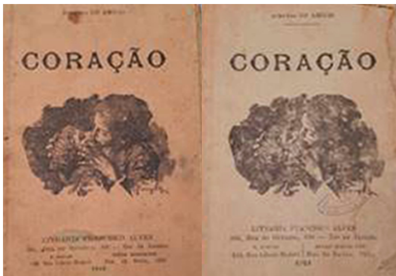
Figura 1: ed. 1916 (A) e 1924 (B).

espaço de página; a dimensão da mancha gráfica é de 9 cm X 14 cm, indicando tratar-se de edição econômica, conforme contribuições sobre projeto gráfico de Antônio Celso Collaro (2000).