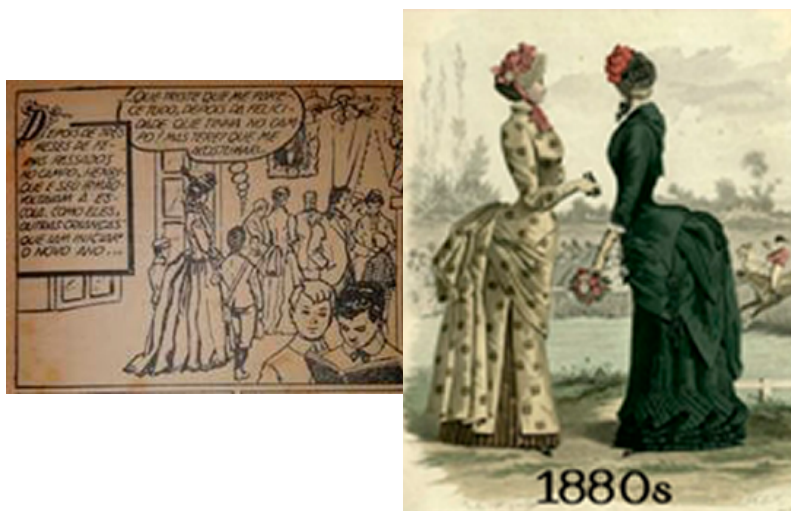
Figura 9: Vestimenta feminina: quadrinhos 1 ed. Ibis