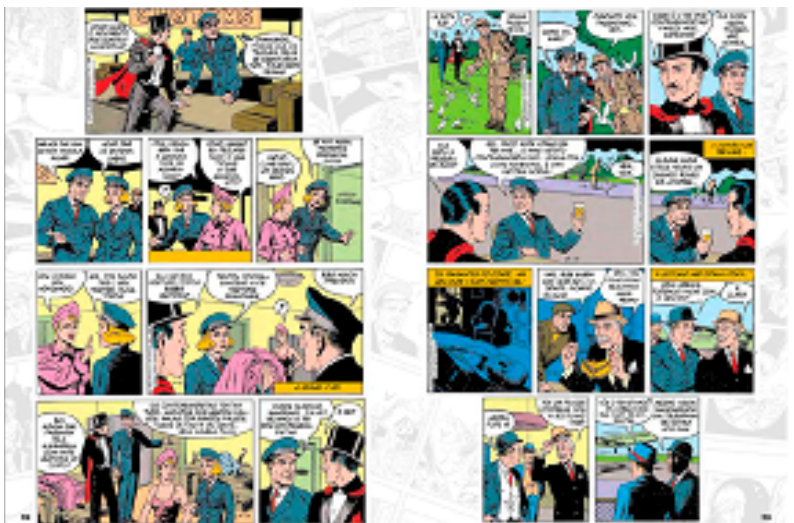
Figura 11: Quadrinhos “Mandrake”, produzidos de 1934 a 1994