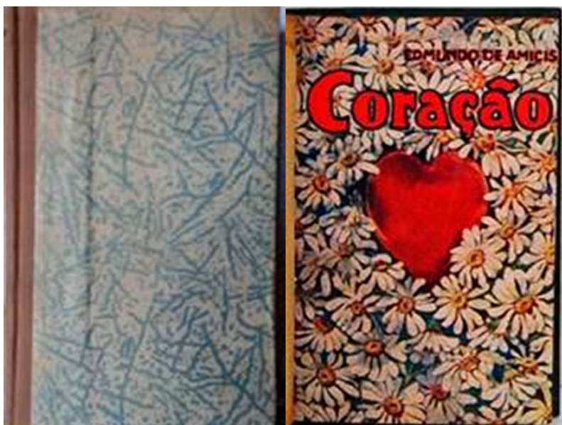
Figura 3: Exemplar restaurado e capa original

O terceiro exemplar analisado nesta investigação 15 segue essa mesma organização, de texto e ilustrações intercalados, e serve para exemplificar essa relação. O livro mantém o mesmo formato padrão de bolso e diagramação dos dois anteriores; possui 264 páginas protegidas por capa dura, com indícios de restauração em papel estampado (Figura 3A).