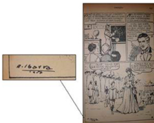
Figura 12: Ilustração com ampliação da assinatura de Ibarra, 1957.

A ausência de data de edição no exemplar de Coração analisado é uma lacuna que procuramos sanar utilizando as referências do ilustrador Alfredo Ibarra, 23 citado no verso da folha de rosto. Esse artista é mencionado por Jesús Cuadrado (2000, p. 649) como responsável pela ilustração da edição em língua espanhola do livro Corazón , em 1957. O estudioso faz menção, igualmente, à encarregada pela adaptação, Pilar Gavín, também presente nos registros e nos dados editoriais do volume. Na página 147 da edição, Ibarra assina a ilustração, e coloca a data (1957). Em vista desse detalhe, pode-se confirmar a referida informação de correspondência de datas com a provável edição desse volume (Figura 12).