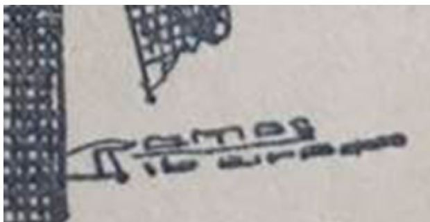
Figura 4: Ilustradores – assinaturas.

Para corroborar o provável período de tempo, incluímos indícios fornecidos nas imagens e na identificação de seus autores, já que o diferencial do volume, comparado aos anteriores, é o de apresentar ilustrações internas na técnica do desenho a bico de pena. No caso dessa edição, os desenhos foram realizados por dois reconhecidos artistas e ilustradores portugueses de seu tempo, 17 António José Ramos Ribeiro (1888-19--), que assinava Ramos (Figura 4A), e Alfredo Januário de Moraes (1872-1971), identificado nas ilustrações como Alfredo Moraes (Figura 4B), conforme registros da Biblioteca Nacional de Portugal.