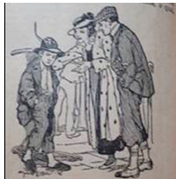
Figura 5: Conto mensal de novembro: ilustração

O exame geral das ilustrações evidencia a sua função descritiva: são cenas que espelham o narrado em gestualidade, e as personagens são traduções visuais do evento contado pela palavra. Alguns detalhes são importantes, como o estilo das roupas e acessórios dos personagens ilustrados, que mostram usos de época e auxiliam na exploração de possibilidades para estabelecer um período de tempo para a publicação, apesar das indicações de data da narrativa em si. Por exemplo, na página 22, em que há o conto mensal do mês de novembro, “O pequeno patriota de Pádua” (Figura 5), a ilustração, feita por Moraes, representa um casal com vestimentas que denotam aspectos relacionados à moda vigente no início dos anos 1920.