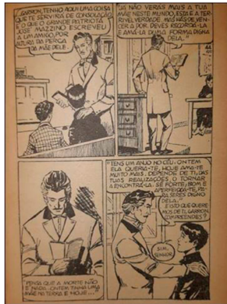
Figura 10: Representação masculina; quadrinhos de Alfredo Ibarra