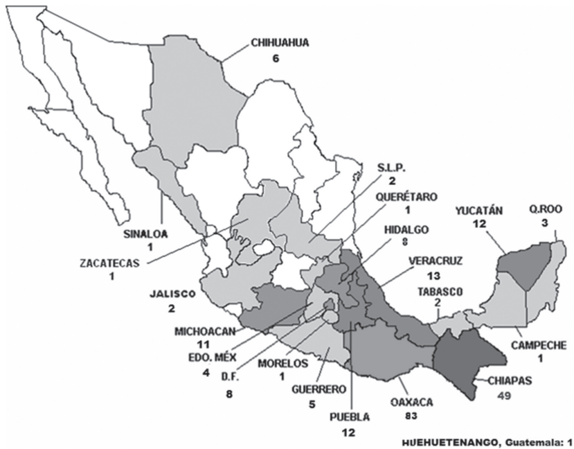
MAPA 1 BECARIOS. ESTADOS DE ORIGEN