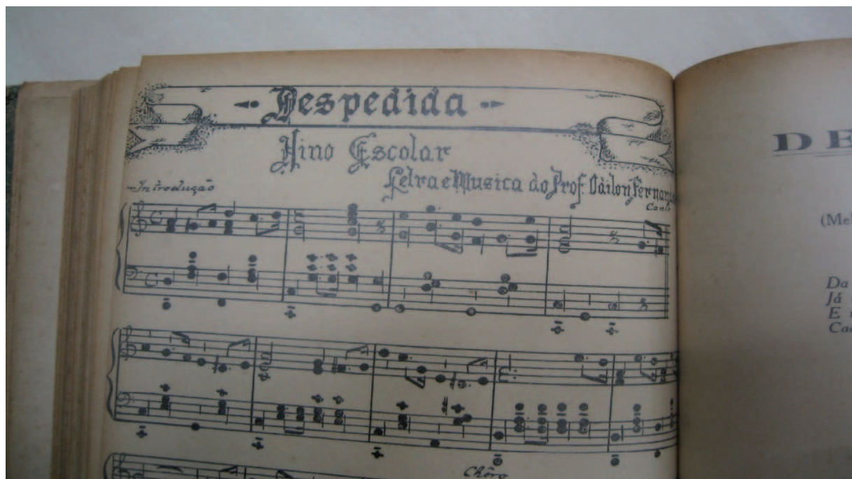
Figura 1 - Publicação da partitura musical Despedida

Odilon Fernandes, professor catedrático da disciplina de História das Civilizações do Instituto de Educação, também compôs um hino escolar para despedida dos formandos do Curso Normal, para que os alunos cantassem na sua festa de graduação (Figura 1).