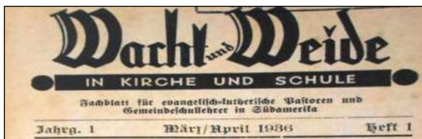
Figura 1 - Fragmento com identificação da 1ª edição da revista