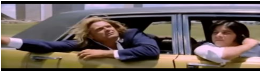
Figura 3 – Brahms exaltando o Brasil