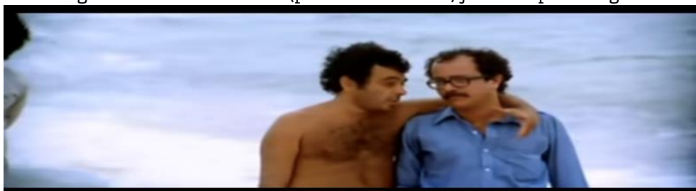
Figura 22 - Glauber Rocha (produtor do filme) junto ao personagem

O aparecimento de Glauber Rocha em algumas cenas remonta à questão de tornar a obra a mais real possível. Ele não se preocupava com a composição estética refinada e padronizada presentes, predominantemente, nos filmes comerciais e isso é perceptível até mesmo nas próprias cenas em que há jogo de luzes e instabilidade da câmera. A proposta, portanto, era fazer um filme experimental que não fosse uma mera produção, tecnicamente perfeita.