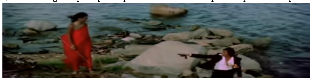
Figura 14 - Nessa imagem é perceptível que a câmera ora foca o plano superior ora o plano inferior