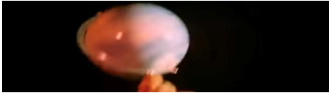
Figura 17 - Filho de Brahms e o globo terrestre