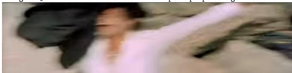
Figura 13 - Tarcísio Meira - o Cristo- Militar - principal personagem desta cena