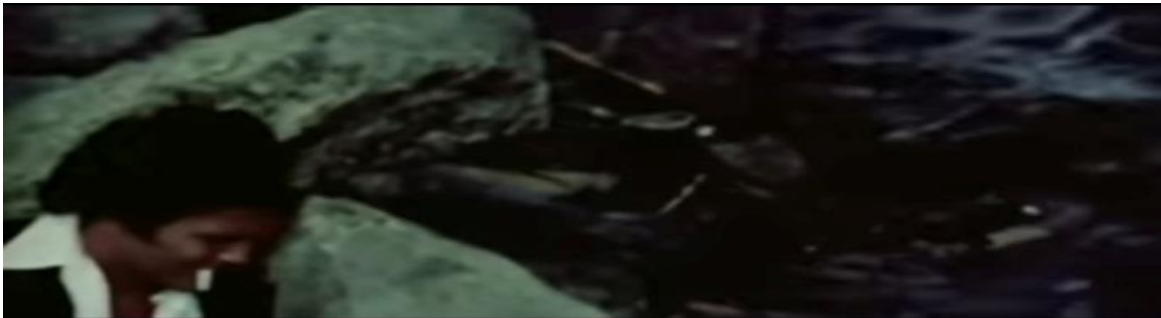
Figura 15 - Por vezes, nesse plano-sequência, as imagens escurecem instantaneamente