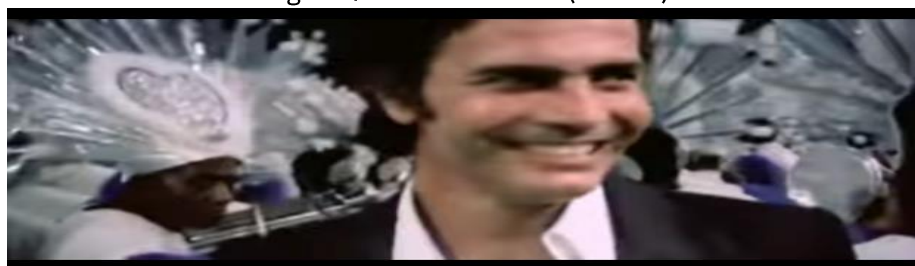
Figura 7 - Tarcísio Meira (militar)