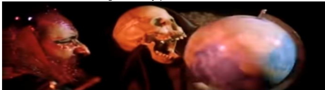
Figura 19 - Projeção sócio-histórica