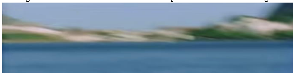
Figura 12 - O movimento brusco da câmera provoca esse efeito na imagem