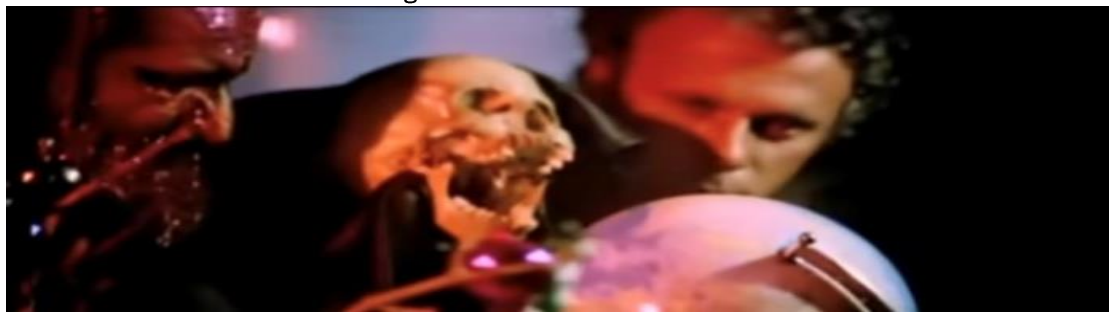
Figura 18 - Rituais sincréticos