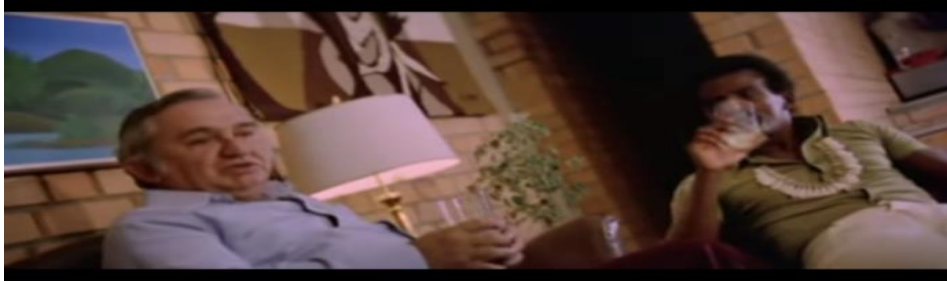
Figura 23 - Castelo Branco e o Cristo-negro dialogando sobre política