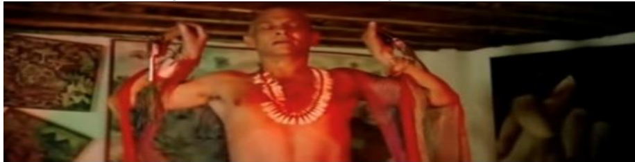
Figura 5 - Geraldo Del Rey (guerrilheiro)