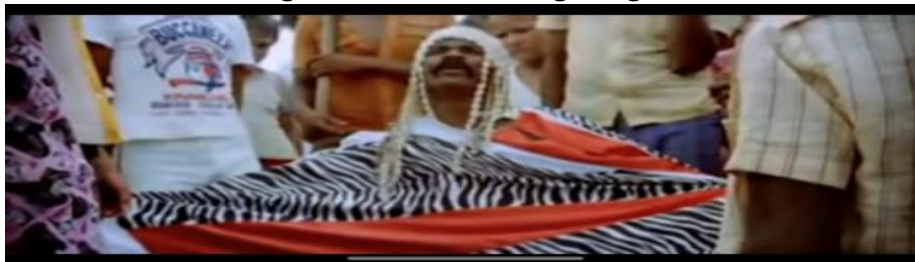
Figura 6 - Antônio Pitanga (negro)