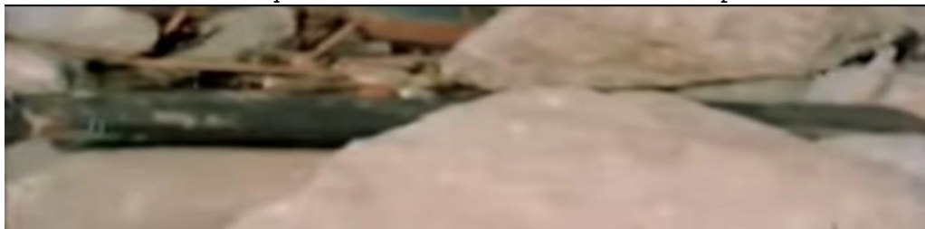
Figura 11 - Início da cena em que a câmera se move constante e causa pouca nitidez na imagem