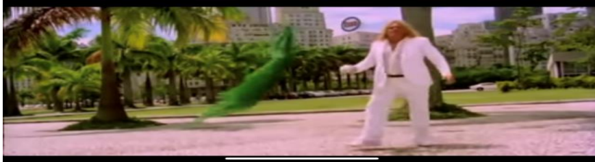
Figura 2 – Brahms – o estrangeiro imperialista em Brasília