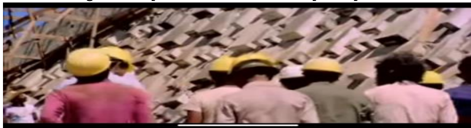
Figura 24 - Operários, demonstrando o povo oprimido

Nesse sentido, observa-se que várias cenas do filme, de modo geral, remetem o espectador à colonização e ao discurso revolucionário e isso porque retoma o passado histórico e por ser predominantemente histórico, o filme é repleto de imagens dialéticas. Na Figura 24, em que aparecem os trabalhadores próximos à pirâmide, eles mencionam “Somos prisioneiros dessa pirâmide” e, em seguida, o próprio Glauber Rocha narra “No final do século XX, existem os países capitalistas ricos e os países capitalistas pobres e os socialistas ricos e os socialistas pobres. Na verdade, o que existe é o mundo rico e o mundo pobre”. Dessa forma, o passado histórico, do Brasil, assume um novo sentido na atualidade para que possa ser entendido em suas contradições econômicas e sociais.