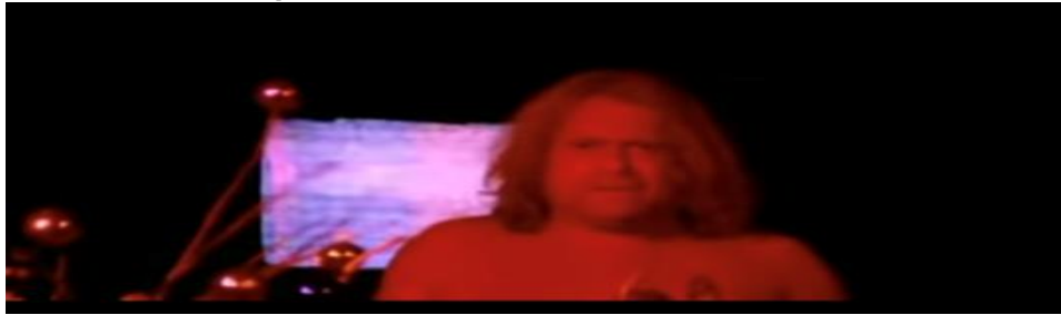
Figura 21 - Brahms refletindo sobre o ritual