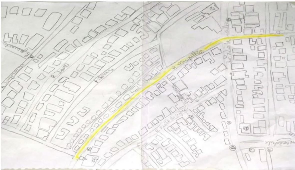
Figura 1. Desenho da aluna "I", antes da prática do esporte de orientação.

Dos que vivenciaram o esporte, duas características se mostraram frequentes. A primeira é a forma de apresentação do desenho. No questionário, o desenho ficou com escala maior em relação ao primeiro e se manteve a clareza para mostrar os detalhes do lugar. A aluna "I", por exemplo, conseguiu criar um mapa com escala ainda maior daquilo que ela observou no lugar onde mora (Figuras 1 e 2).