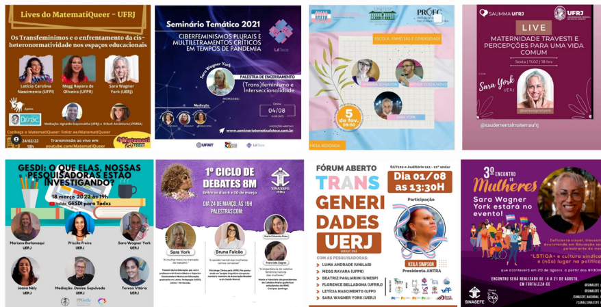
Figura 3 – Prints das conferências e palestras publicada no Instagram.