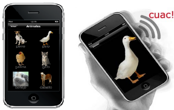
FIGURA 2 - Actividad de exploración en iPod Touch: pulsando en cada elemento se visualiza en grande y pulsándolo de nuevo o agitando el dispositivo se reproduce el sonido asociado

En el tipo de actividades presentadas, el contenido educativo puede encontrarse embebido dentro de un juego (González, Rodríguez, Cabrera & Gutiérrez, 2009). El objetivo es que los alumnos disfruten jugando sin percibir que al mismo tiempo están aprendiendo conceptos y adquiriendo habilidades socio-afectivas. En el caso de las actividades en grupo, además se motiva al alumno a considerar la existencia e intervención de otras personas para jugar y terminar la actividad de forma satisfactoria.