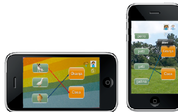
FIGURA 3. Actividad tipo asociación con distintas opciones de personalización para diferentes usuarios.

En el caso de las actividades en grupo, la actividad puede ser la misma para todos los alumnos pero es posible personalizar el valor de algunos parámetros variando el contenido, la representación o el desarrollo de la actividad (ver Tabla 4).