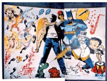
Figuras 07 e 08 – Grafites de Alex Vallauri em São Paulo