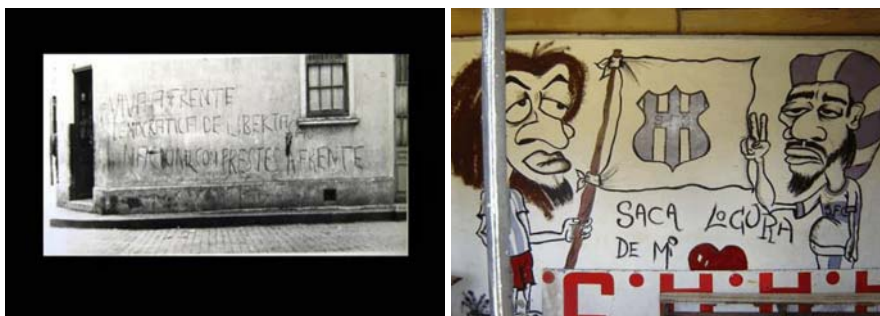
Figuras 03 e 04 – Diferentes sentidos da pichação: como mensagem política e como demarcação de um grupo

...Grafites Urbanos (pichação e grafite) são, na forma como são exercidos e no comportamento libertário de seus agentes, uma linguagem, além de artística, também política, que constrói novas significações dentro do espaço urbano e público. (PENNACHIN, 2003, p. 5)