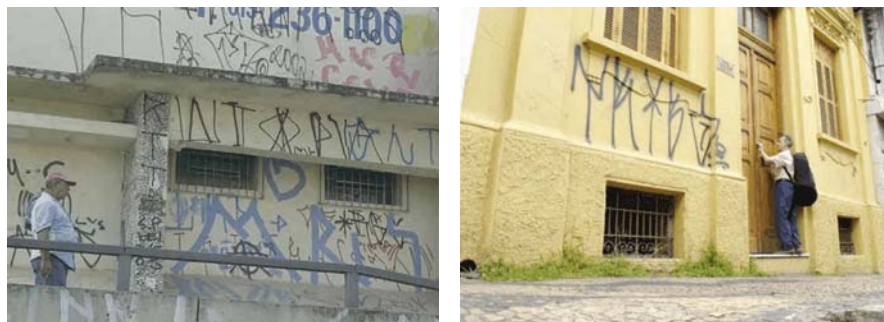
Figuras 05 e 06 – Prédios localizados em áreas centrais das cidades de São Paulo e Campinas

O jovem pichador não se identifica com os elementos da cidade. Para ele, o que significa a estátua em homenagem a Carlos Gomes? E a sede da banda que leva o mesmo nome do compositor, se suas músicas são o rap, o funk? O que significa estar no centro diante das inúmeras edificações, se sua referência de lugar é a periferia? (SALES, 2007, p. 57)