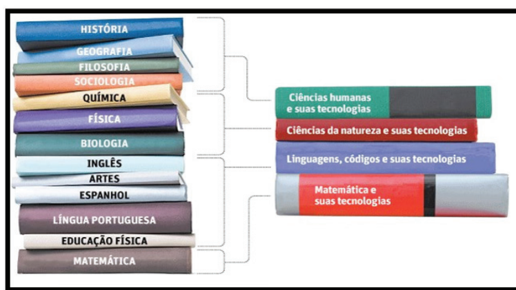
Imagem 2 – Reestruturação no Ensino Médio.

Destaca-se, ainda neste viés, que a politécnica, após a reestruturação, trouxe uma nova disciplina às escolas da rede pública de ensino: Seminário Integrado 4 – SI. O tensionamento das áreas do conhecimentos dobra-se diante do Seminário Integrado, pois este passa a ser a ponte de origem e retorno dos saberes e da materialização dos trabalhos e produção de aprendizagem na politécnica. A disciplina, já supracitada, possui matriz na pesquisa, tornando-se cerne essencial para a construção do conhecimento conectado com o mundo do trabalho, constituindo-se como recurso pedagógico à produção do conhecimento de forma individual e coletiva, uma vez que permite ao estudante, agora considerado pesquisador, acesso à condição de criador, questionador e sujeito da construção do próprio saber.