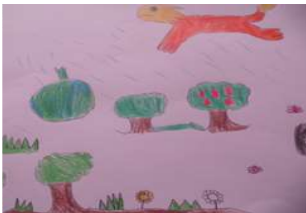
Figura 1 – Desenho da Natureza

As figuras apresentadas abaixo são alguns dos desenhos realizados pelas crianças sobre Natureza, a partir das ilustrações realizamos a categorização dos ícones, apresentados nos gráficos 7 e 8.