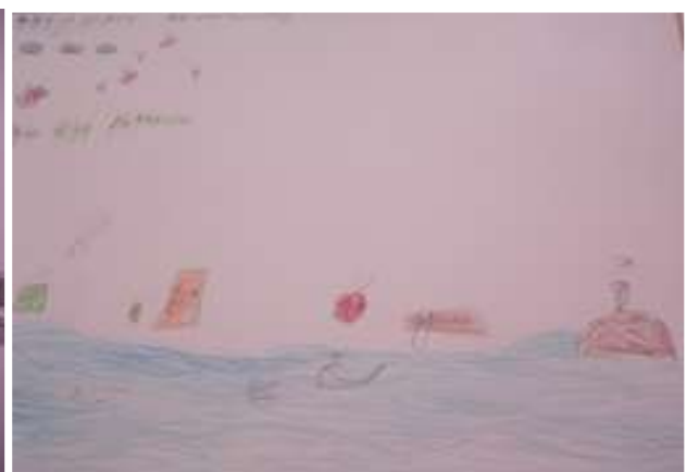
Figura 2 - Desenho da Natureza