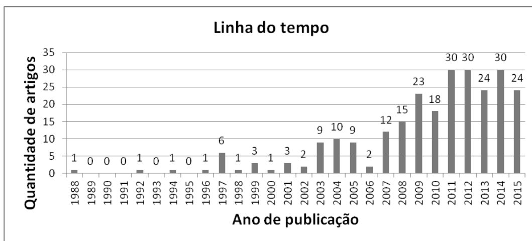
Figura 1. Distribuição das publicações ao longo do tempo.