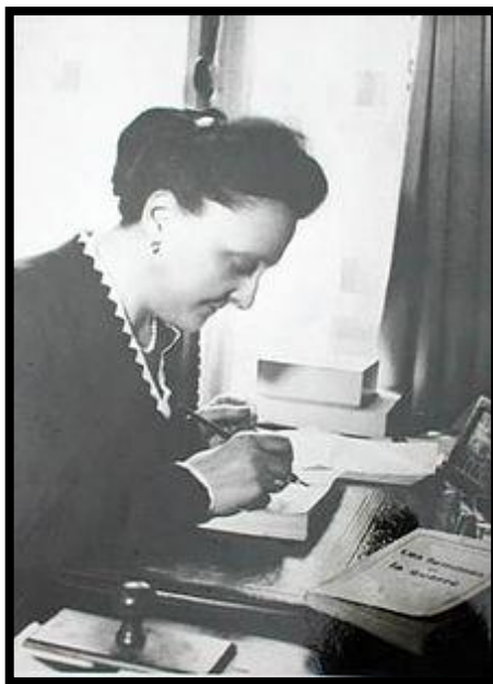
Figura 1 – Marguerite Vérine-Lebrun