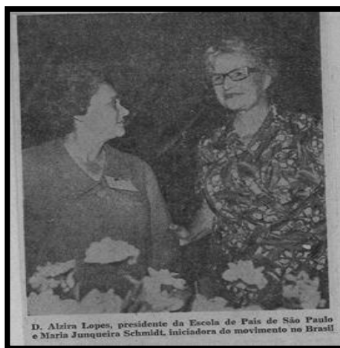
Figura 3 - Iniciadora do movimento da Escola de Pais no Brasil.