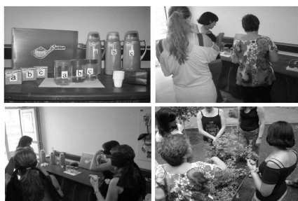
Figura 2. (A) Materiais utilizados para a realização da atividade (B) e (C) Professoras participando da atividade “Chá dos sentidos”

A busca em utilizar o conhecimento prévio sobre as plantas durante as atividades revelou uma preocupação com os nomes das espécies, o que é, geralmente, observada nos professores de Ciências e Biologia que sempre associam a dificuldade de ensinar e aprender Botânica com a grande quantidade de nomes (KINOSHITA et al , 2006). Considerando que historicamente a Botânica foi apresentada a partir de critérios nomenclaturais e descritivos (SILVA, 2008), encontramos dificuldades em abordar os estudos dos vegetais a partir das relações desses seres vivos com o ambiente, por exemplo. Esse comportamento, apresentado pelas professoras, mostra ainda uma preocupação com o conhecimento científico adquirido em sua formação.