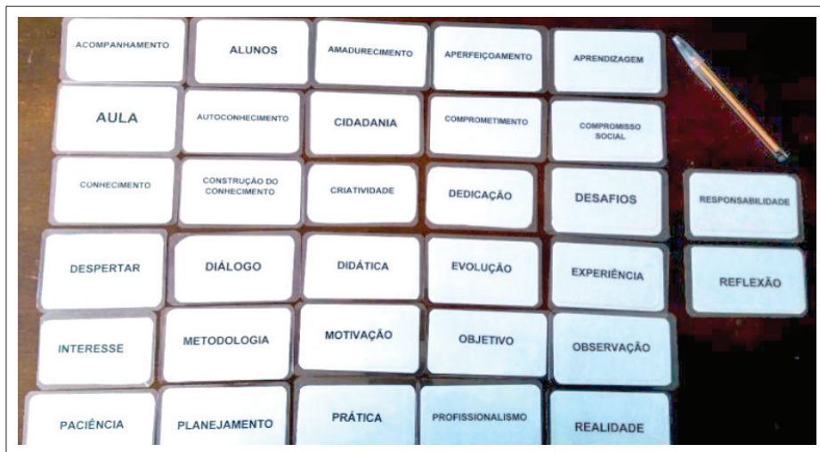
Figura 1. Fichas utilizadas na triagem hierárquica sucessiva

alunos do 4º ano, participantes ou não participantes do PIBID, na proporção 1:1 da Licenciatura de Ciências Biológicas. Priorizou-se a escolha dos informantes das Ciências Biológicas para o aprofundamento das informações na entrevista por ser esse o espaço de inserção dos pesquisadores.