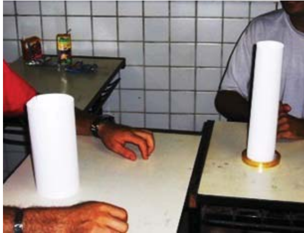
Figura 3 | Cilindros construídos pelos (futuros) professores

participantes, de que um tinha como base um círculo menor e era mais alto, e o outro uma altura menor (o mais largo), pode ser observada na figura a seguir: