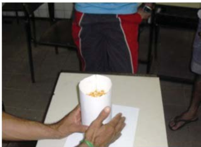
Figura 10 | Cilindro mais baixo com uma parte vazia

Foi possível observar que o milho que preenchia, anteriormente, todo o cilindro mais alto não foi suficiente para “encher” o cilindro mais baixo: