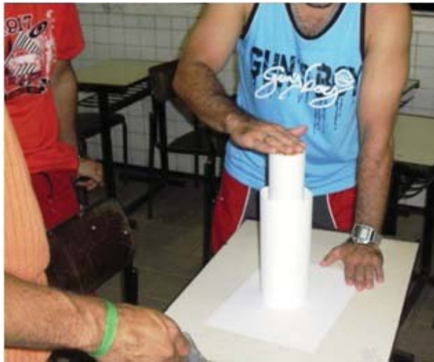
Figura 8 | Cilindro mais alto (cheio de milhos) dentro do cilindro mais largo

Para isso, o pesquisador pediu que fossem à frente e, utilizando uma mesa, solicitou que colocassem o cilindro mais alto dentro do cilindro mais largo. Em seguida, forneceu-lhes grãos de milho para que preenchessem completamente e com cuidado o cilindro mais alto com o milho que receberam.