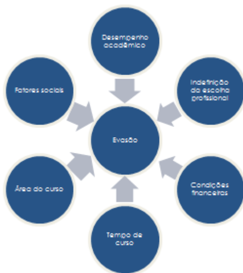
Figura 2 Principais variáveis que interferem na evasão institucional da Universidade em 2011