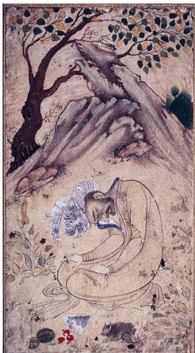
FIGURA 1 – UM SUFI EM ÊXTASE EM UMA PAISAGEM

FONTE: Isfahan, século 17.