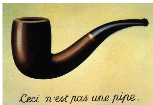
FIGURA 2 – A TRAIÇÃO DAS IMAGENS. 1929

A ilustração a que Ginzburg se refere é o quadro de René Magritte: