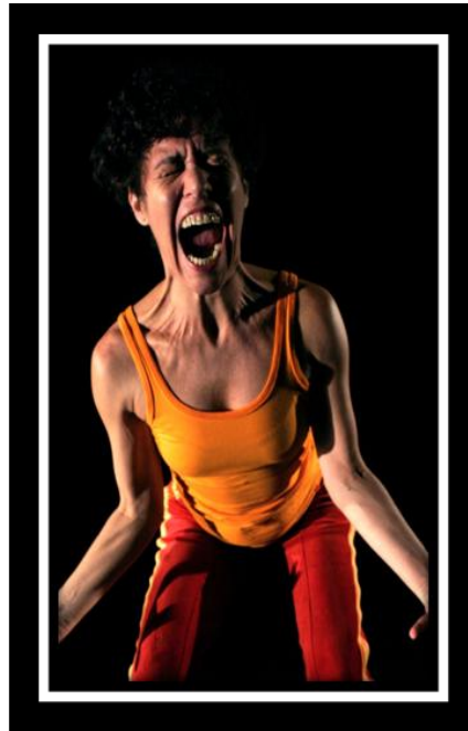
FIGURA 2 – Solo Absolutamente Só 12

No Absolutamente Só , no final tem uma fala minha que quase ninguém percebe. Meu corpo é outro, meu rosto é outro. Eu sou a força a imagem que eu queria ter sido. Eu sou o que eu imaginei que vocês queriam que eu fosse.