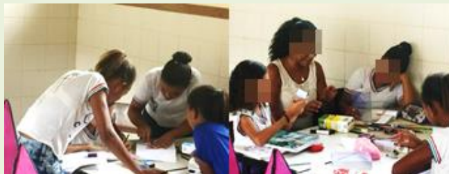
FIGURA 2 – Cenas da aula da professora Hipotenusa

A figura 2 mostra duas cenas da aula da professora Hipotenusa, uma do grupo de estudantes, em que a estudante com DI participava e a outra mostrando a professora interagindo com outro grupo durante a atividade com embalagens.