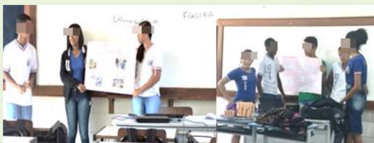
FIGURA 3 – Cenas da aula do professor Triângulo: apresentação em grupo

Para além de um conhecimento sólido em matemática, é preciso conhecer os estudantes, “bem como metodologias diversificadas que lhe permitam fazer opções adaptadas às diferentes situações e promover a participação de todos” (MARTINHO, 2016, p. 9). A figura 3 apresenta cenas da aula do professor Triângulo.