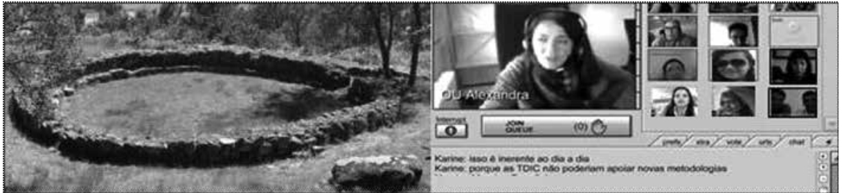
Figura 3 – Territórios da comunicação interpessoal: homo loquens versus homo digitalis

Fonte: Elaborado pelos autores deste artigo.