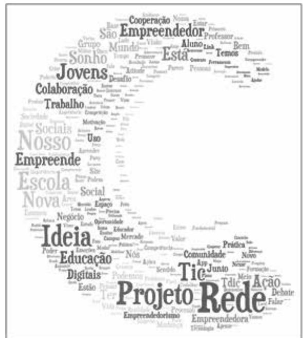
Figura 4 – Nuvem de palavras sobre o Coemprender

Fonte: Elaborado pelos autores deste artigo.