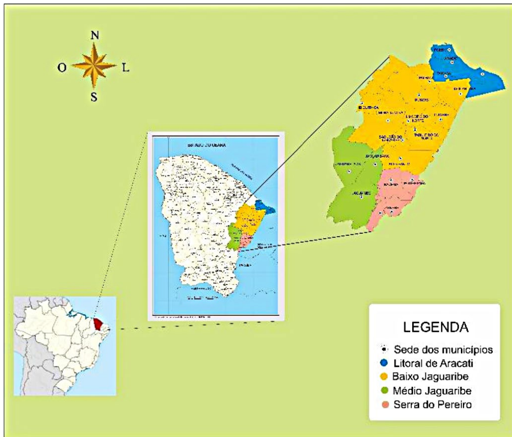
Figura 2 – Região do Vale do Jaguaribe