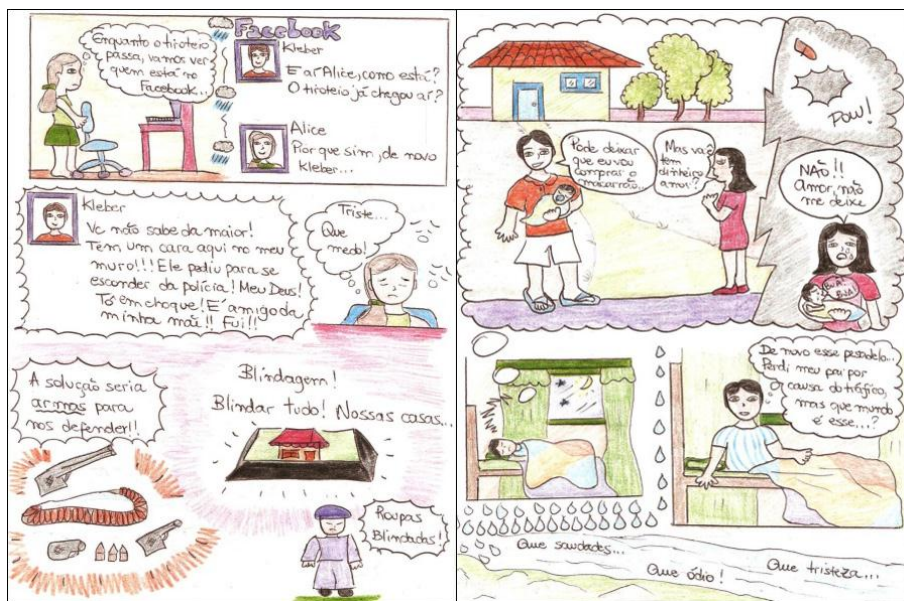
Figura 1: parte da história em quadrinhos produzida pela pesquisadora.