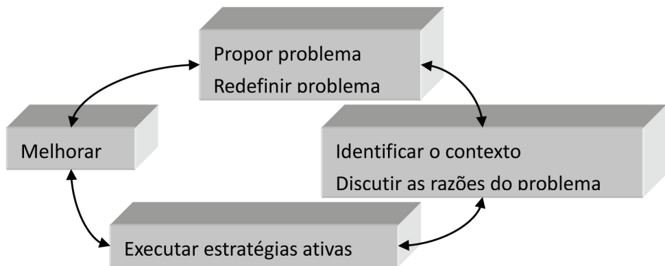
Figura 2. O processo da pesquisa-ação em educação

A pesquisa-ação é sobre os “atores”, isto é, o pesquisador e o participante estabelecem a relação de confiança da parceria. É na interação desses atores que a vida deles se transforma e melhora (Xia, 2004). Donald A. Schön pensa que o pesquisador-ator-realizador-da-reflexão precisa ter coragem para enfrentar diretamente a complexidade, a incerteza, a instabilidade, a singularidade e o choque de valores diferentes proporcionados na prática situacional. Como Dewey afirma em Lógica: a teoria da investigação , o problema se constitui nas situações desequilibradas e incertas; é necessário, muitas vezes, o experimento da angústia, preocupação ou dúvida, para que possamos entendê-lo profundamente. O pesquisador-ator não se autodetermina como o único capaz de promover orientações relacionadas e importantes, nas específicas situações. O pesquisador considera sua própria incerteza o material de aprendizagem de si mesmo junto com o participante. (Schön, 2007, p. 14)