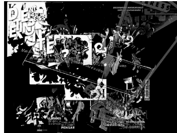
Figura 2. Imagem do vídeo Cores Secas em imagens da ciência .

Cérebro-turbinado, o que pode um cotidiano que prolifera ao experimentar?