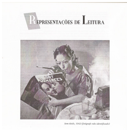
Figuras 03 e 04: Revista Leitura: Teoria & Prática , nº 33, 1999. Capa e p. 44