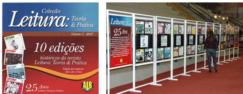
Figuras 07 e 08: 25 Anos da Revista Leitura: Teoria & Prática , CD-Rom Comemorativo e foto da Exposição, 2007