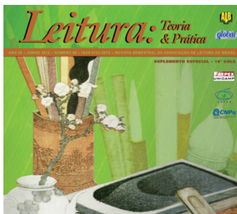
Figura 10: Suplemento especial da LTP, com textos do 18º COLE, publicado em CD-ROM em 2012.