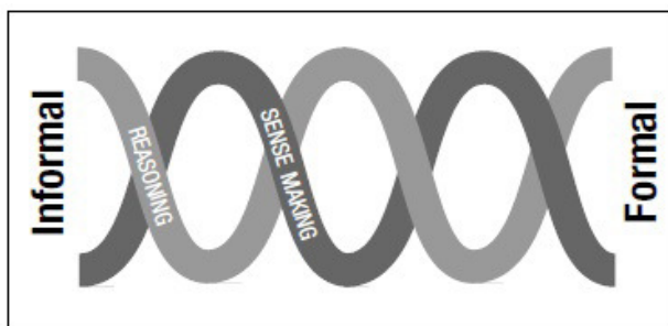
Figura 2 - Relação entre raciocínio e significação

Estritamente relacionado com as conexões encontra-se o conceito de significação ( sense making ). Segundo o NCTM, a significação consiste em desenvolver a compreensão de uma situação, contexto, ou conceito conectando-o com conhecimento existente (NCTM, 2009). Neste sentido, a significação apenas é possível ao estabelecer conexões. O documento Focus in High School Mathematics: Reasoning and Sense Making (NCTM, 2009) assume a significação como um aspeto do raciocínio e também o raciocínio como aspeto da significação. Por um lado, o raciocínio formal poderá basear-se em significação que identifica elementos comuns através de determinadas observações e que percebe como esses elementos comuns estabelecem conexões com situações anteriores (NCTM, 2009). Por outro lado, o raciocínio dedutivo ajuda a compreender o significado do que está a ser demonstrado, ou seja, a ver não só o que é verdade mas também porque é verdade (HANNA, 2000). Nesta situação é a significação que se baseia em raciocínio. Esta relação permite compreender que raciocínio e significação se encontram entrelaçados ao longo do processo contínuo entre as observações informais e as deduções formais (Figura 2) (NCTM, 2009).