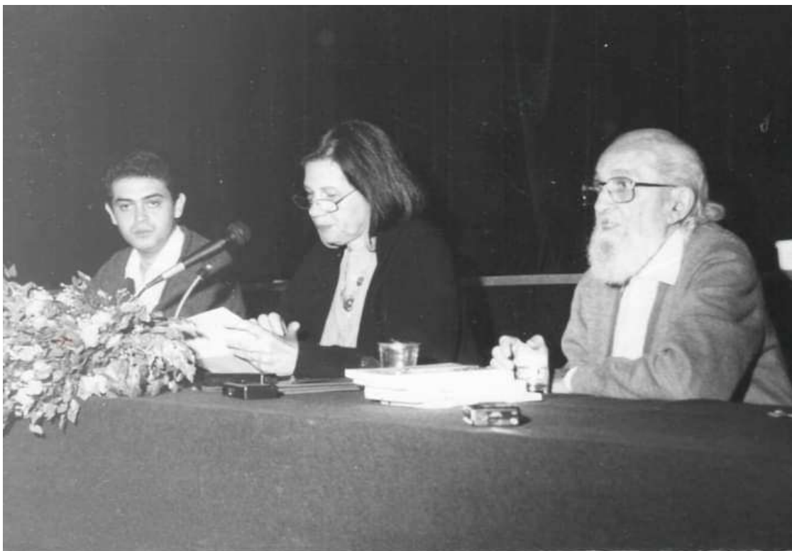
Figura 1 - Mesa dos trabalhos no Grande Auditório da UEPG (26/09/1992)