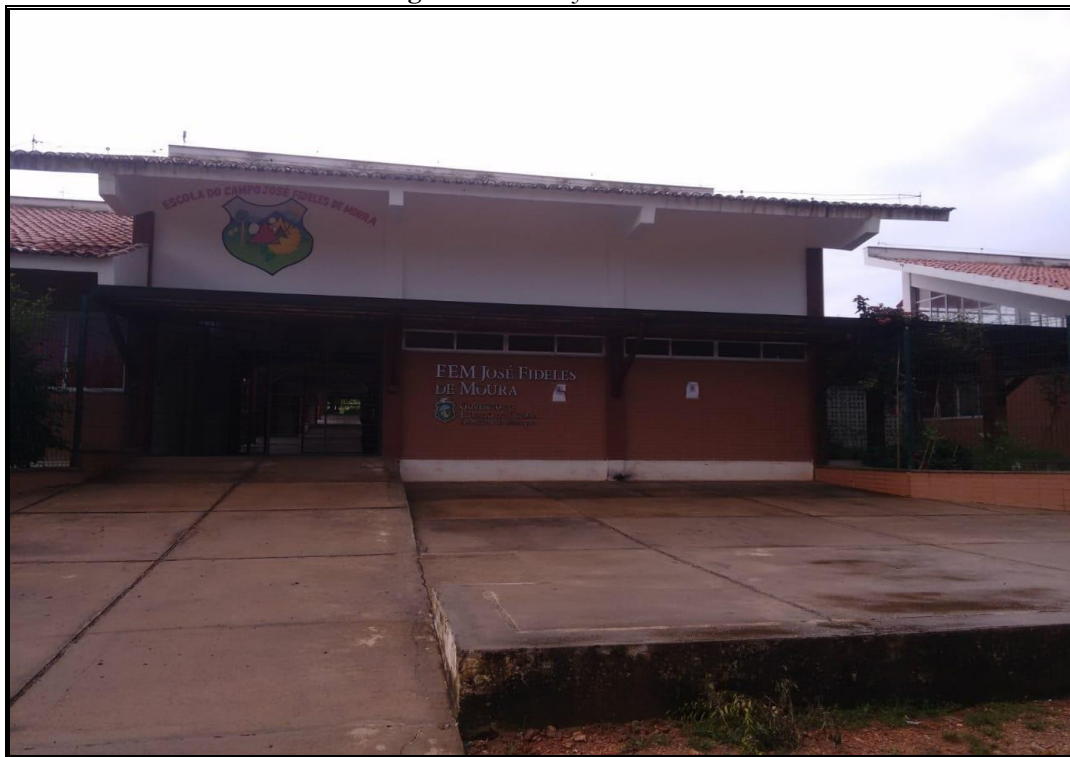
Figura 1 - Escola José Fidelis de Moura