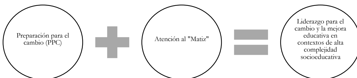
Figura 1 - Liderazgo con sentido del matiz para el cambio

Desde este trabajo, se propone que las estrategias orientadas al cambio educativo que llevan a cabo líderes y lideresas pueden ser más efectivas, si logran combinar el desarrollo de la atención al matiz, como capacidad de liderazgo, con el despliegue de la PPC, como una actitud de parte de la comunidad educativa. A su vez, un liderazgo con foco en el matiz puede favorecer la PPC, al ayudar en la comprensión, el desarrollo de emociones favorables y comportamientos proclives al cambio, por parte de los miembros de la escuela y, con ello, propiciar una activa participación para lograr objetivos compartidos (Galdames et al., 2017).