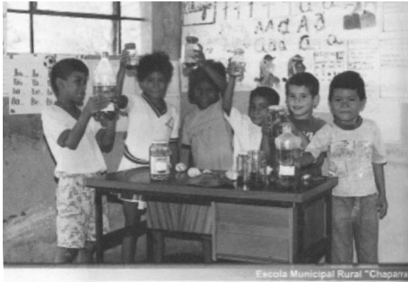
Figura 4 — Escola Sarã – Cuiabá nos ciclos de formação: na política educacional do presente, a garantia do futuro. Cuiabá, MT, jan. 2000, p. 56