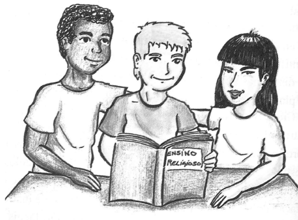
Figura 1 – Escola Sarã – Cuiabá nos ciclos de formação: na política educacional do presente, a garantia do futuro. Cuiabá, MT, jan. 2000, p. 114

Na Figura 1, temos o desenho de três crianças: à direita, uma que apresenta características indígenas, à esquerda uma criança negra, e ao centro uma criança branca segurando um livro em suas mãos. Levando-se em conta que o estereótipo de que ter livros é deter conhecimentos, bem como a centralidade do menino branco, essa figura sugere minimamente que o etnocentrismo permanece invisível para as agências políticas da Escola Sarã. Além disso, a homogeneização com que representam as diferentes identida-