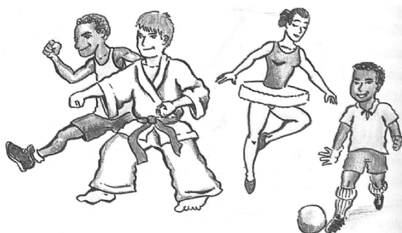
Figura 3 – Escola Sarã – Cuiabá nos ciclos de formação: na política educacional do presente, a garantia do futuro. Cuiabá, MT, jan. 2000, p. 122

abordagem metodológica que pressupõem os temas geradores; em consequência, reforçam a insuficiência dos propósitos de uma abordagem curricular multicultural nela presentes.