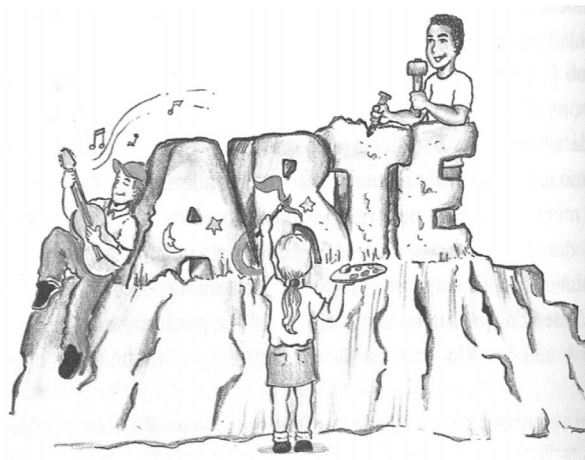
Figura 2 – Escola Sarã – Cuiabá nos ciclos de formação: na política educacional do presente, a garantia do futuro. Cuiabá, MT, jan. 2000, p. 118

Na Figura 2, temos novamente três crianças, sendo duas brancas e uma negra. Das crianças brancas, uma está tocando violão e a outra, pintando. Já o menino negro está esculpindo uma letra, com uma marreta na mão, o que sugere, por sua vez, o estereótipo de que os negros foram feitos para o trabalho braçal, marcando, portanto, uma forte discriminação racial, um exemplo nítido de racismo, uma vez que estigmatiza e inferioriza uma identidade étnica perante as demais.