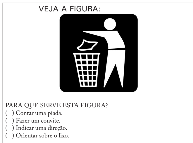
Figura 3 – Teste final do Provinha Brasil (Brasil, 2010b, questão 17).

Essa mesma habilidade – reconhecer finalidade do texto – foi avaliada na prova final nos itens 17 e 21. Na questão 17, sugere-se a leitura de texto não verbal.