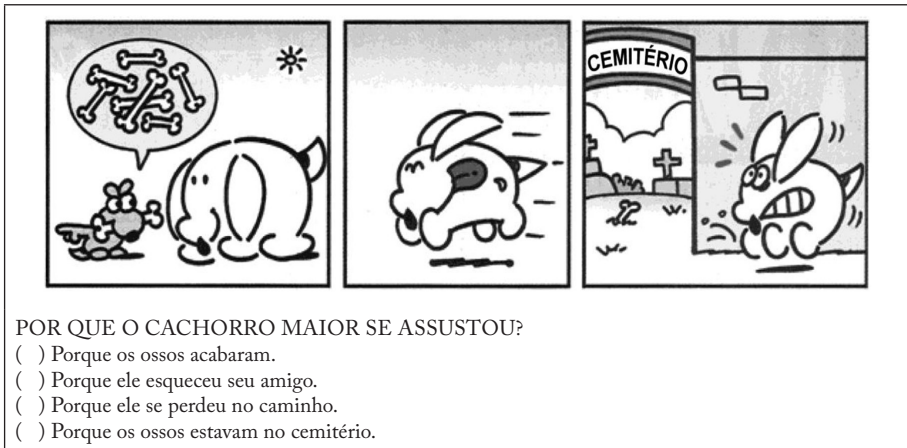
Figura 15 – Teste final do Provinha Brasil (Brasil, 2010b, questão 20).

Na avaliação final, a elaboração inferencial foi avaliada com base em apenas uma questão. Na questão 20, a inferência é exigida em uma tirinha, um gênero que geralmente requer muita elaboração inferencial para a constituição de sentidos. No entanto, por ser um texto predominantemente não verbal, não exige domínio de leitura autônoma de texto verbal. Além disso, na questão da avaliação inicial, a leitura das alternativas requeria autonomia de leitura.