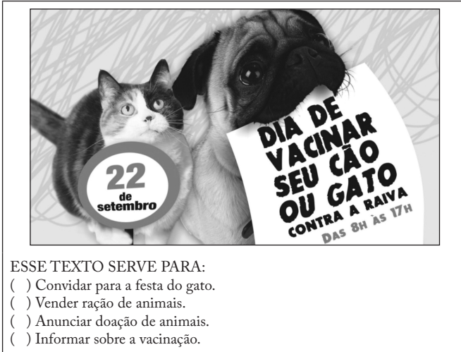
Figura 1 – Teste inicial do Provinha Brasil (Brasil, 2010a, questão 15).

Na questão 15, portanto, se a criança realizar a leitura da palavra “vacinar” no cartaz, já poderá responder à questão corretamente, dado que as alternativas são lidas pelo aplicador do teste. Na questão 23, a formatação do texto e a leitura do título já indicam a resposta a ser dada, sobretudo porque a palavra que aparece no título está presente na alternativa correta.