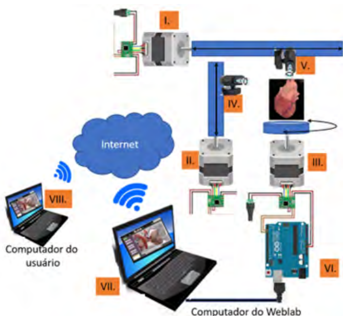
Figura 1. Diagrama dos dispositivos do Weblab Anatomia.

A plataforma Weblab Anatomia foi testada durante a aula de Anatomia, em atividade que consistiu em três exercícios que exigiram o acesso ao sistema pela internet e o controle dos três mecanismos para visualização das peças anatômicas dispostas na mesa de forma semelhante à aula presencial. Os estudantes conseguiram realizar a atividade, pois localizaram, observaram e identificaram as estruturas utilizando as vistas lateral e superior das duas câmeras.