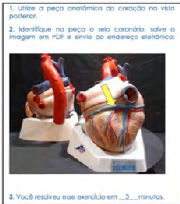
Figura 3. Exemplo de exercício executado pelo estudante.